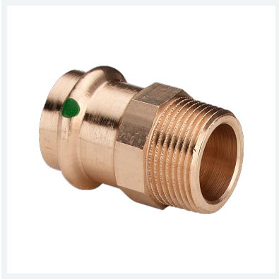
Sanpress-Übergangsstück mit SC-Contur Modell 2211 Artikel 115 340