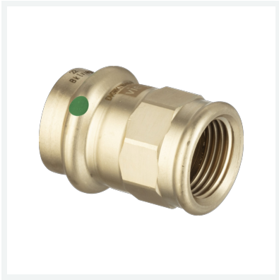
Sanpress-Übergangsstück mit SC-Contur Modell 2212 Artikel 365 097