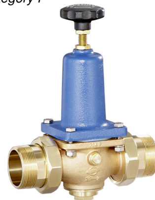
DN 40 - DN 65 (DRV 402-6)